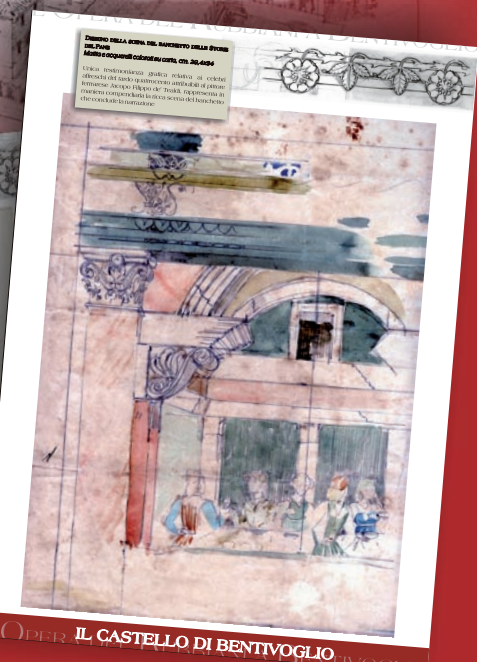
L'OPERA DEL CASTELLO DI BENTIVOGLIO

Disegni originali e storia dell'Architetto bolognese a Bentivoglio