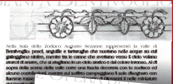
Nella Sala dello Zodiaco Augusto Sezanne rappresentò la valle di Bentivoglio, prati, angurie e farnetuglio che ruotano nelle acque su cui galleggiano i fiori, incorniciato tra le colonne che svettano verso il cielo veduto dall'alto di anatre, che si stagliano in un ciclo statico e dal colore bruno. Al di sopra della scena della valle come una fascia decorata con lo zodiaco ed alcuni costellari, mentre sul soffitto campeggiano il sole disegnato con strati rosei, il cielo è decorato con un arcobaleno e il nido di formiche.