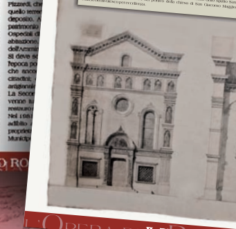
L'OPERA DI IL PROGETTO DELLA CHIESA