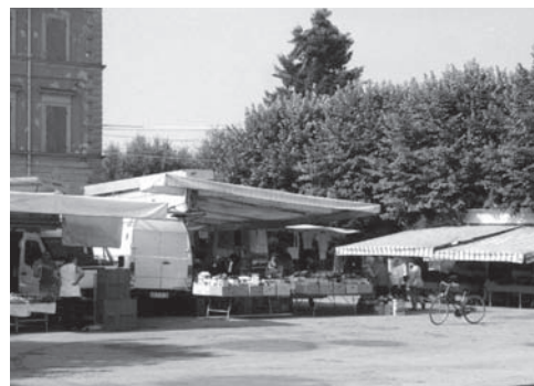
Il mercato in Piazza dei Martiri