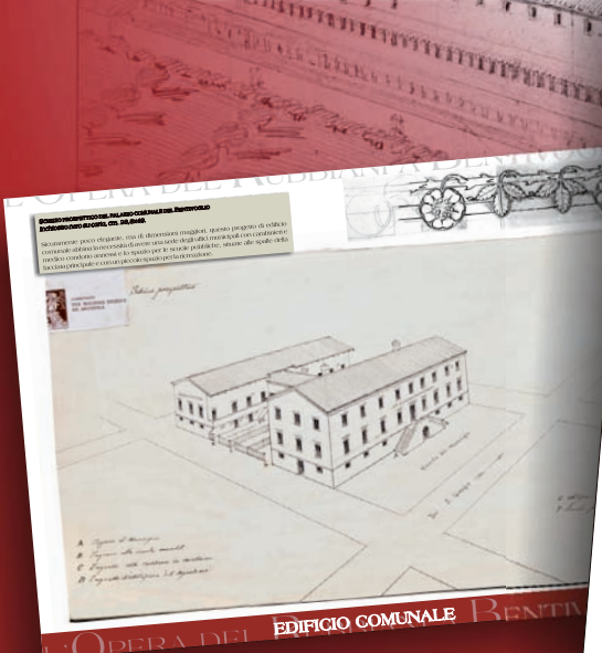
L'OPERA DEL EDIFICIO COMUNALE