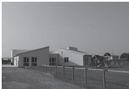
L'asilo nido di Bentivoglio

Per maggiori informazioni telefonare allo Sportello Sociale del Comune di Bentivoglio (tel. 051/66.43.508).