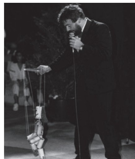
La Marionetta Slangslang in Il circo più piccolo che c'è