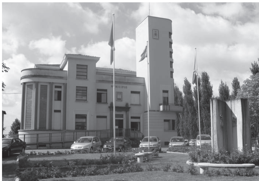
Il Municipio di Bentivoglio