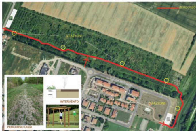
Localizzazione del Percorso vita a nord di Bentivoglio

Nello specifico il percorso vita è un circuito di allenamento all'aperto, accompagnato da punti di sosta attrezzati per l'esercizio fisico dette "stazioni". Il percorso nel bosco di Bentivoglio si svilupperà per una lunghezza di circa 800 metri con cinque stazioni attrezzate, composta ciascuna da