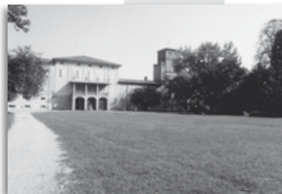
Il Museo della Civiltà contadina

Dal 10 giugno grande riapertura del Baladur L'INCANTO VERDE al Parco di Villa Smeraldi: appuntamento tutti i venerdì sera.