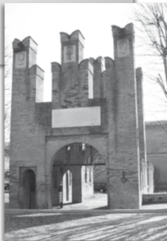
Il Castello di Bentivoglio

Alle 22.30 estrazione dei premi della lotteria. Durante la Festa visite guidate al castello e mercatino di beneficenza.