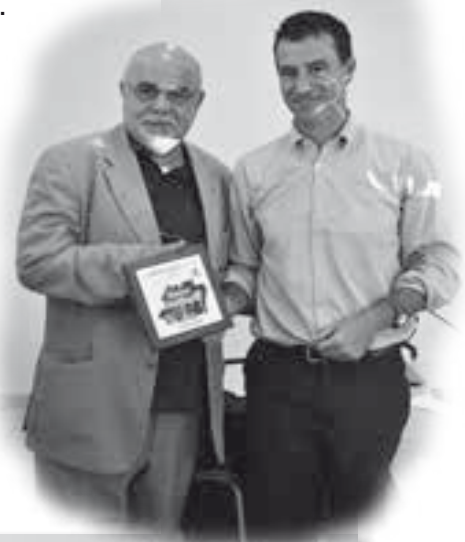
foto di Campionato solare