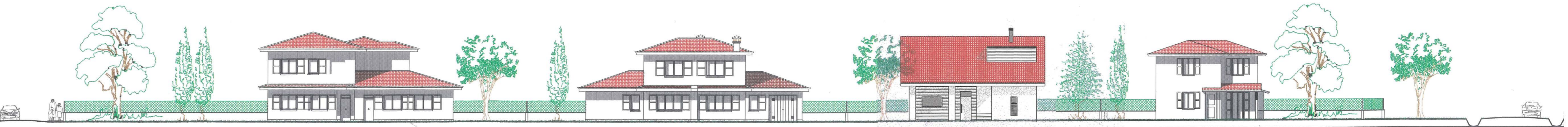
SEZIONE B-B scala 1:200