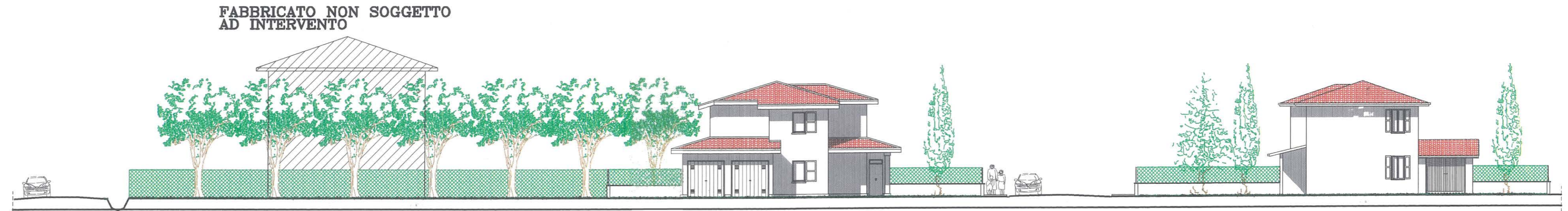
SEZIONE C-C scala 1:200