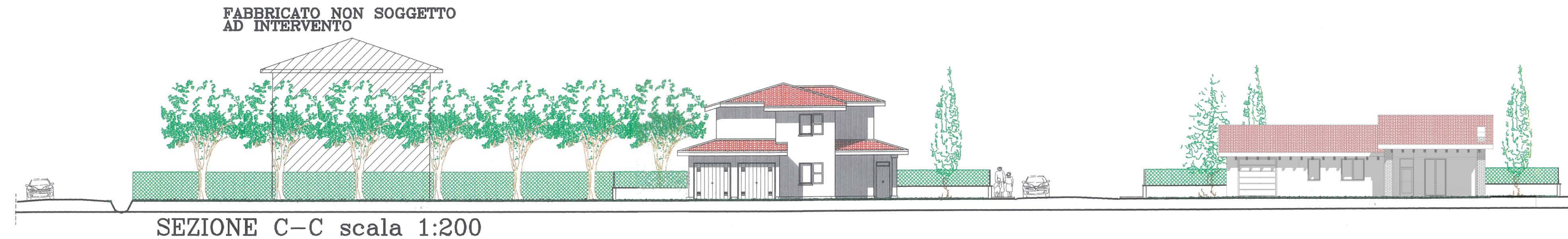
SEZIONE C-C scala 1:200