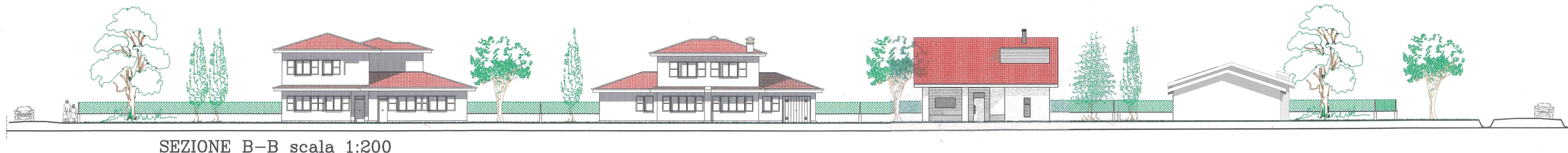
SEZIONE B-B scala 1:200